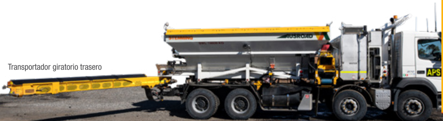
Transportador giratorio trasero